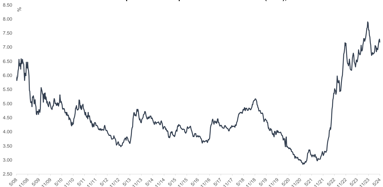
ΗΠΑ: Σταθερό επιτόκιο στεγαστικού δανείου 30 ετών (MBA), 2008 - 2024

► Στις ΗΠΑ, το σταθερό επιτόκιο στεγαστικού δανείου 30 ετών (MBA) παρουσίασε την προηγούμενη εβδομάδα υποχώρηση κατά 11 μ.β. για πρώτη φορά μετά από τέσσερις εβδομάδες ενίσχυσης. Παραμένει ωστόσο σε υψηλά επίπεδα (7,18%, μέσος όρος 20 ετών: 4,9%), αποθαρρύνοντας τις αιτήσεις για στεγαστικά δάνεια.